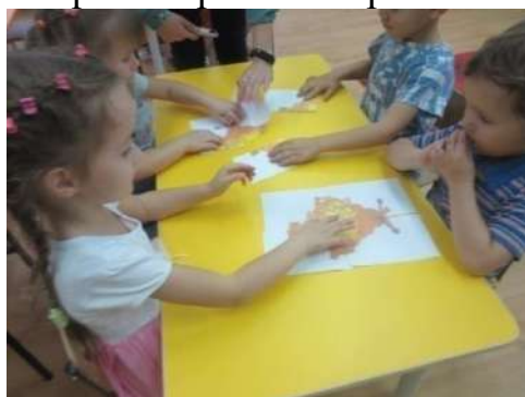
Игра «Разрезные картинки»